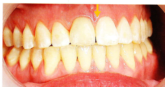
Ergebnis einer MIMI-Sofortimplantation Zahn 11 (orangener Pfeil) nach Eingliederung der Vollkeramikkrone. Das Ziehen des nicht mehr erhaltungswürdigen Zahnes (Extraktion), MIMI-Implantation, Zementierung und Präparation eines sog. „Prep-Caps“ erfolgte in nur einer Sitzung.